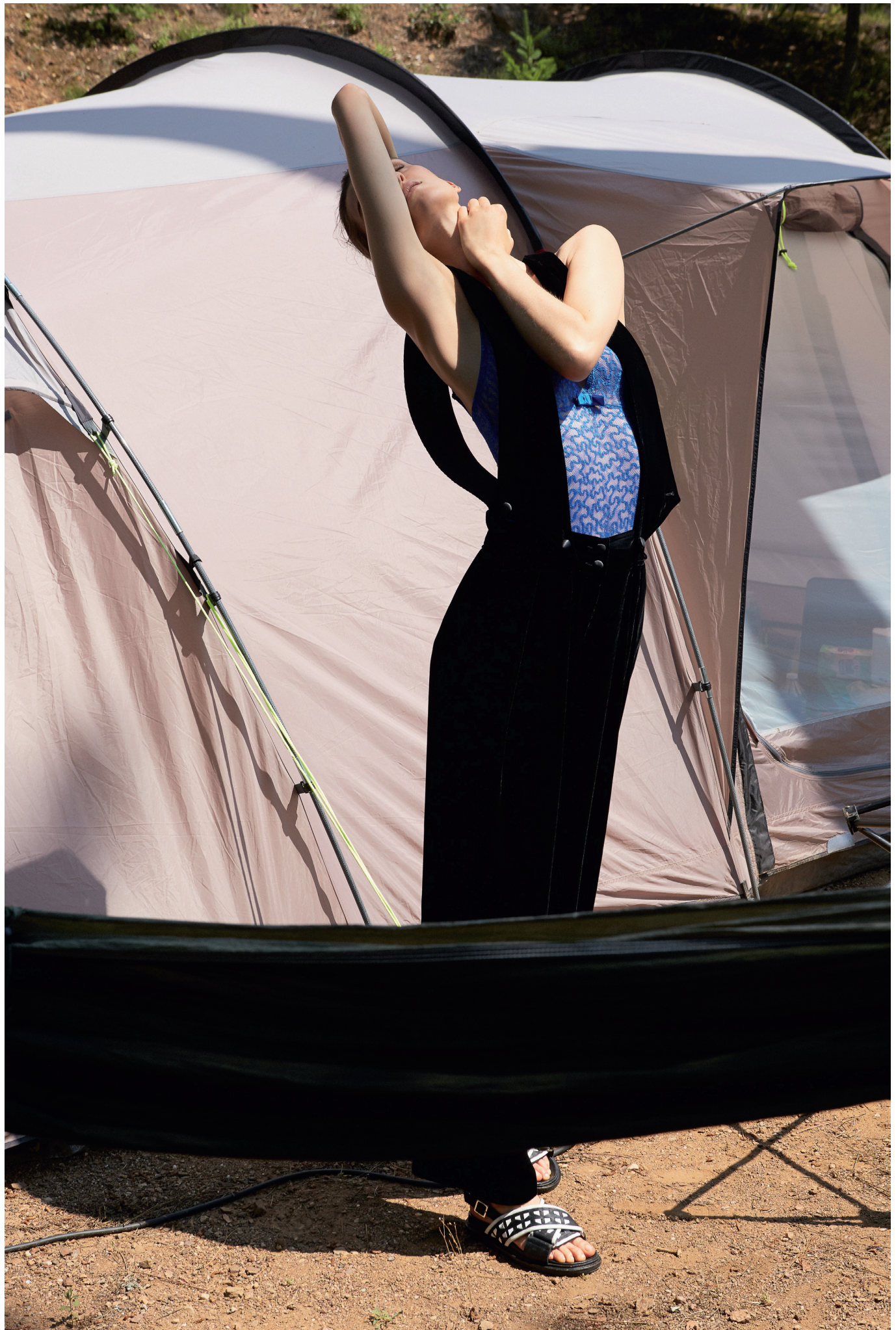
ชุดหมี่ผ้ากำมะหยี่ GIORGIO ARMANI . บอดี้สูท PRINCESS TAM.TAM .