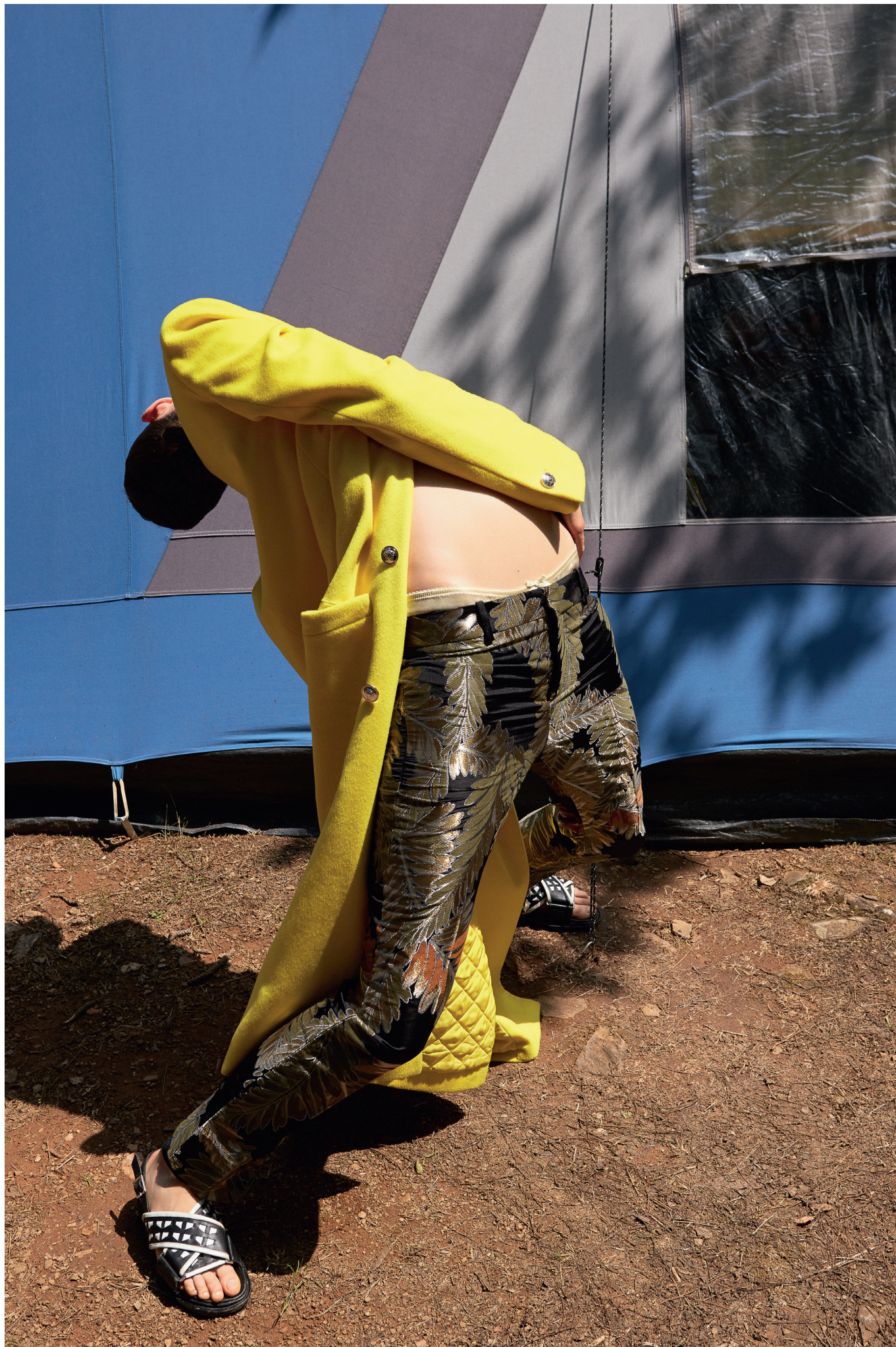
เสื้อคลุมผ้าแคชเมียร์ VERSACE . กางเกงขายาวผ้าไหมพิมพ์ลาย GUCCI .