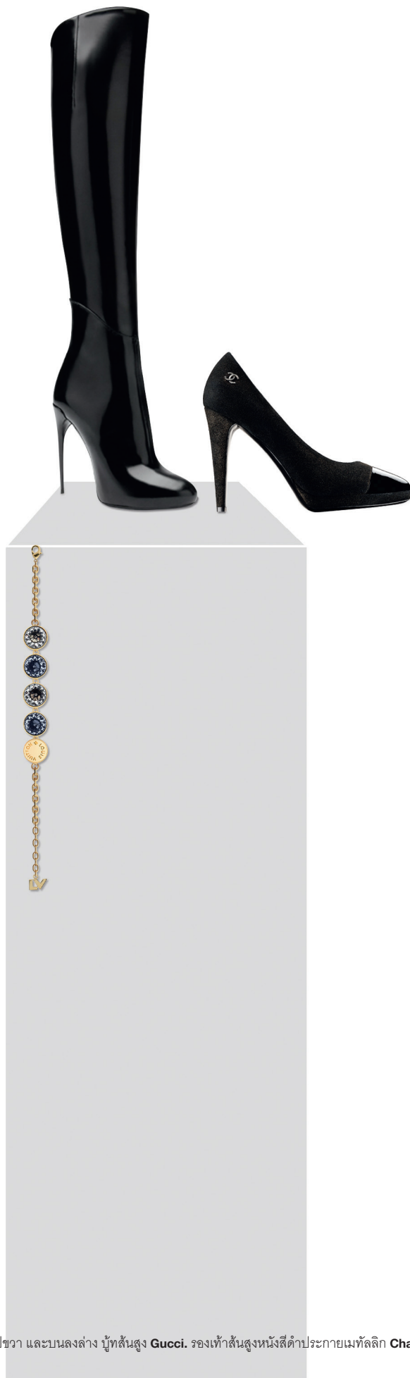
จากซ้ายไปขวา และบนลงล่าง บู้ทสั้นสูง Gucci. รองเท้าส้นสูงหนังสีดำประกายเมทัลลิก Chanel. กำไล Over the Rainbow ประดับคริสตัลสี Louis Vuitton.