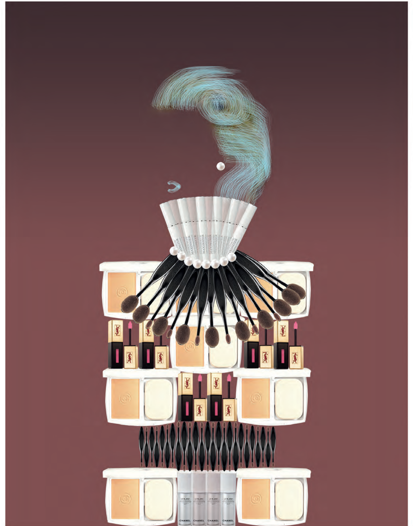
จากซ้ายไปขวาและจากบนลงล่าง ไซมุกสีขาวจากการสร้างสรรค์ Le Blanc Chanel. Diorshow Maximizer - Lash Plumping Serum Dior. แปรงแต่งหน้าจากคอลเล็กชั่น Master Class Brush รุ่น Oval3-72 และ Oval6-72 M.A.C. แป้งรองพื้น Le Blanc Whitening Compact Foundation SPF 25 Chanel. ลิปกลาส RPC Val Rebel Nudes n-104 จากคอลเล็กชั่น Parisian Nite YvesSaintLaurent. เซรั่ม Le Blanc Whitening Double Action Chanel.