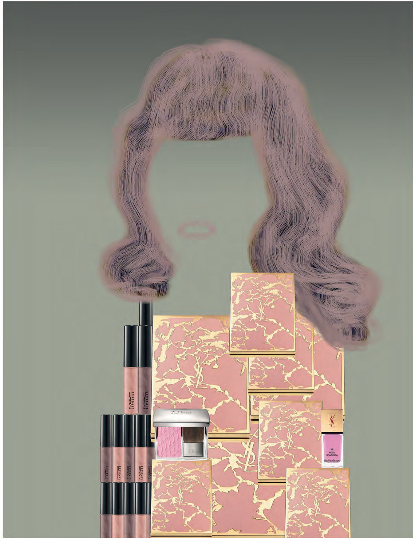
จากซ้ายไปขวา ลิปกลาส Magnetic Nude - Oh My Darling และ Steel Kiss M.A.C. บลัชออน Rosy Glow Blush Dior. บลัชออน Collector Palette Rosy Blush YvesSaintLaurent. ยาทาเล็บ La Laque Couture สีเบอร์ 48 Rose Scabiosa YvesSaintLaurent.