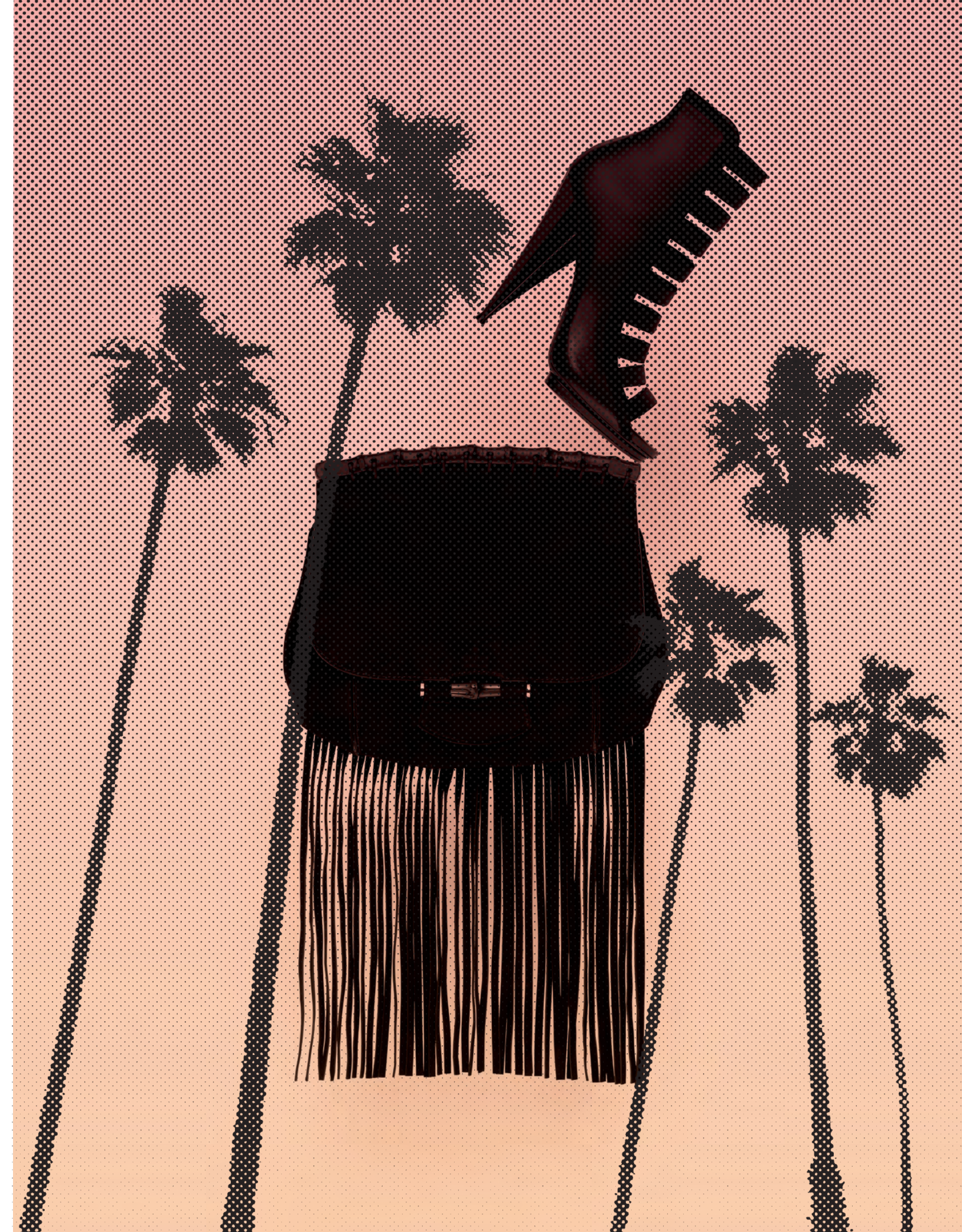
จากบนลงล่าง : รองเท้าบูทสั้นทำด้วยหนังและอีลาสติก กระเป๋าพรีนจ์ "GUCCI NOUVEAU" หนักกลับลูกว้าว GUCCI.

Venice Beach by Rebecca Bleyne, Photos Tania and Vincent แปล ปาณิศจิ อินทภูติ เรียบเรียง อมรสิริ บุญญสิทธิ์