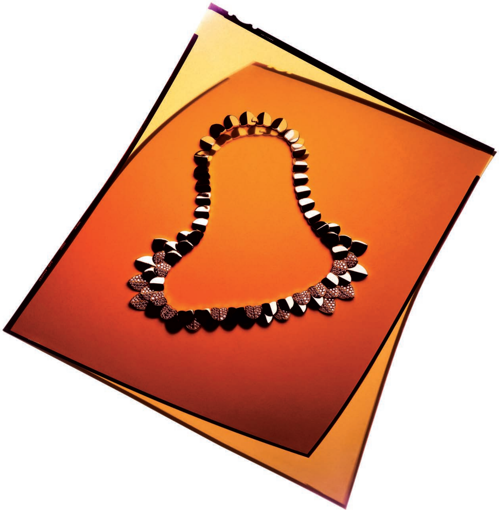
สร้อยคอ "Une île d'Or" จากทองสีเหลืองและเพชร FRED.