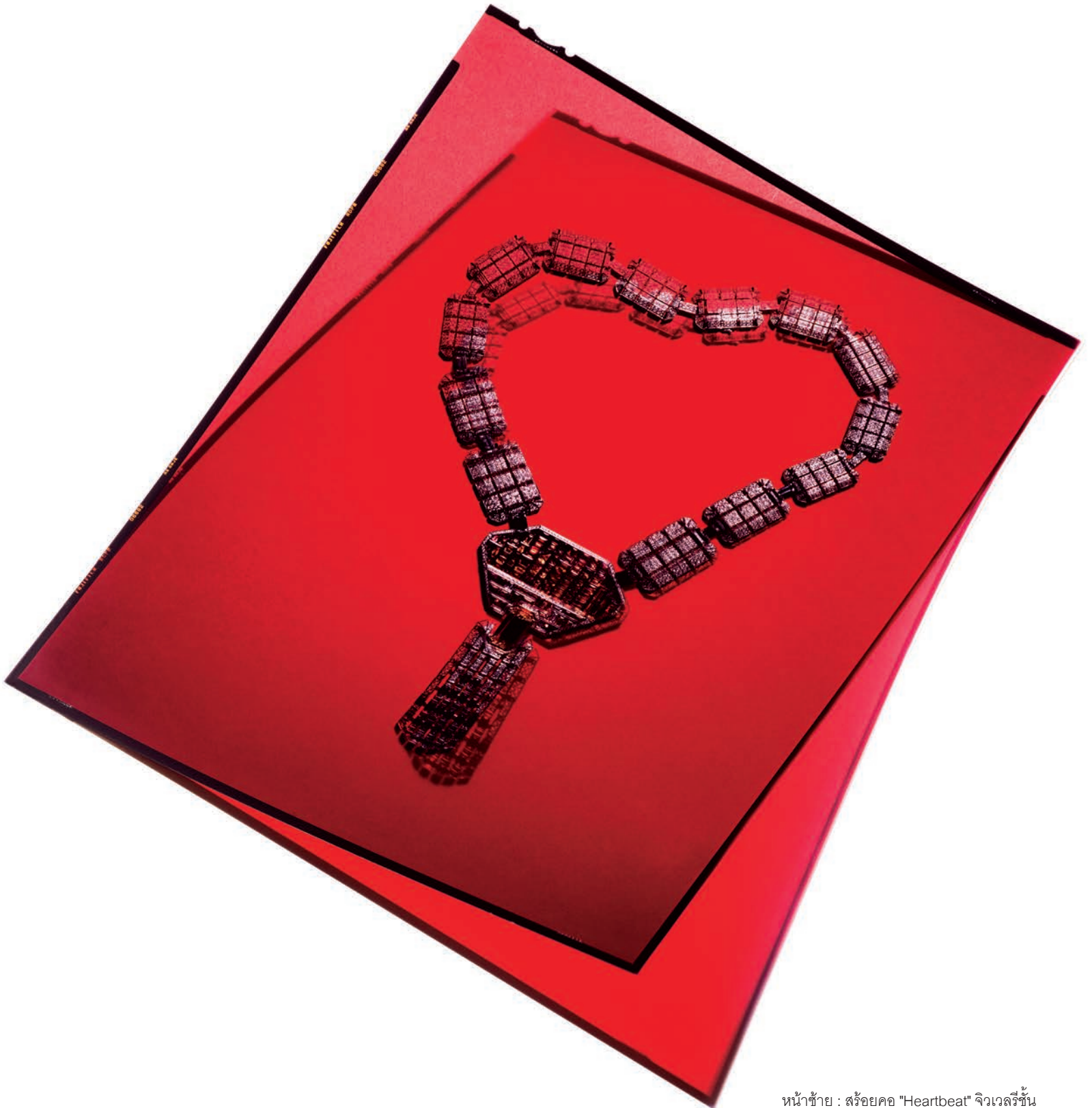
หน้าซ้าย : สร้อยคอ "Heartbeat" จิวเวลรี่ชั้น สูงจากทองขาว เพชรสีขาว และทิวร์มาตินสี ฟ้า AKILLIS . หน้าขวา : สร้อยคอ "Summer in New York" จากทองขาว ทองสีเหลือง เพชร สีเหลือง เพชร และแซฟไฟร์ Café Society collection, CHANEL JOAILLERIE .