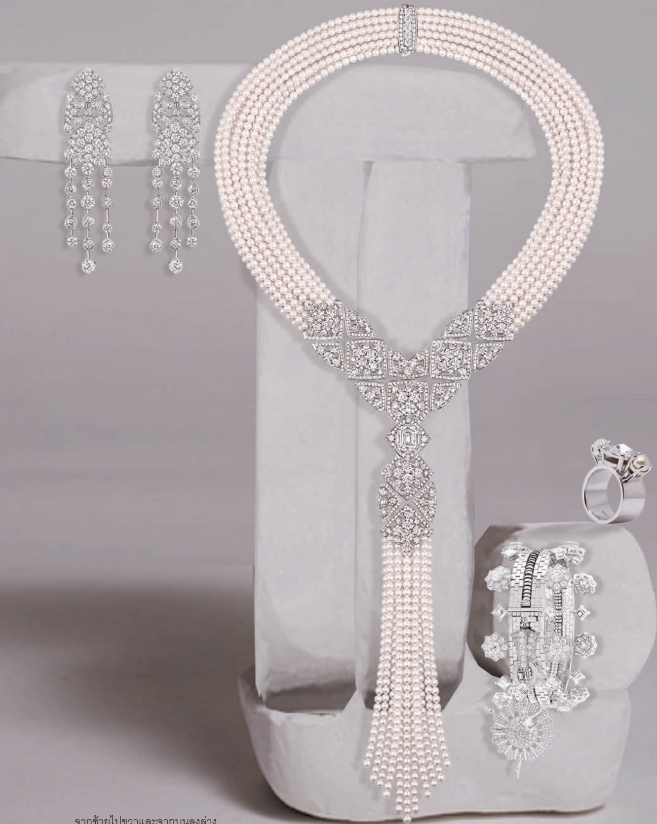
จากซ้ายไปขวาและจากบนลงล่าง ต่างหู Signature Surpiquée CHANEL . สร้อยคอมุกจากคอลเล็กชั่น Signature des Perles CHANEL . กำไลข้อมือชิบเงินประดับ เพชร VAN CLEEF & ARPELS . แหวนเงิน ประดับมุกและคริสตัล MIU MIU .