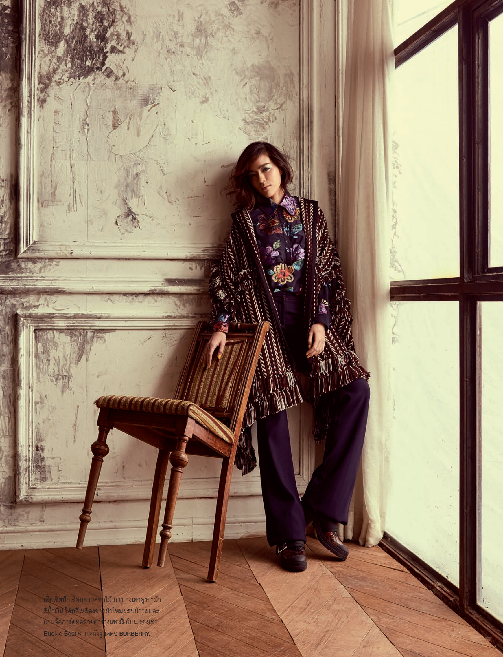
เสื้อแจ็คเก็ตปักเลื่อมลายดอกไม้ กางเกงเอวสูงขำม้า สีน้ำเงิน ไม้เท้าสีเหลืองจากผ้าไหมผสมผ้าวูลและ ผ้าแฉีกการ์ดทอลายตารางเฮอริงบอน ของแท้ Buckle Boot จากหนังตัดต่อ BURLBERRY.