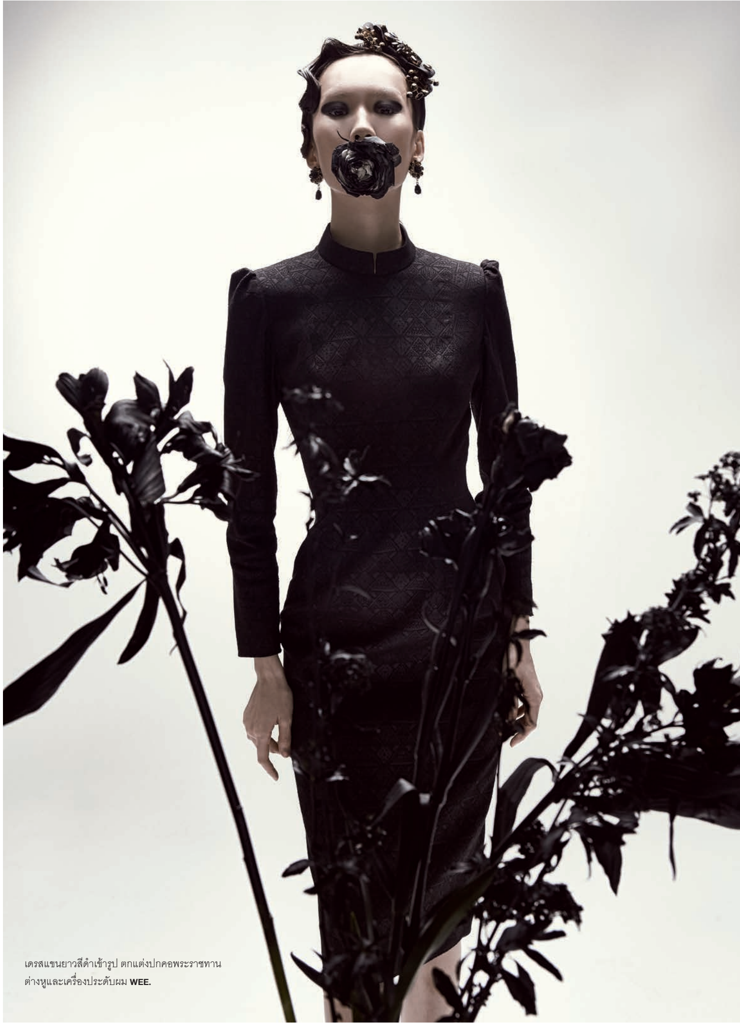
เดรสแขนยาวสีดำเข้ารูป ตกแต่งปกคอพระราชทาน ต่างหูและเครื่องประดับผม WEE.