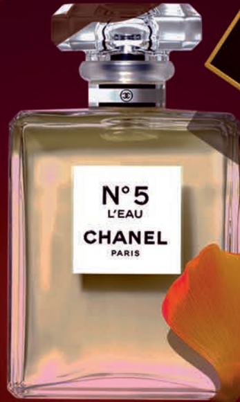
จากซ้ายไปขวา Full Kisses BURBERRY . Liptensity Lipstick M.A.C . N° 5 L'EAU CHANEL . Velvet Matte Lip Pencil NARS . Lipcolor TOM FORD . Rouge Allure Ink Matte Liquid Lip Colour CHANEL . Studio Fix Perfecting Powder M.A.C .