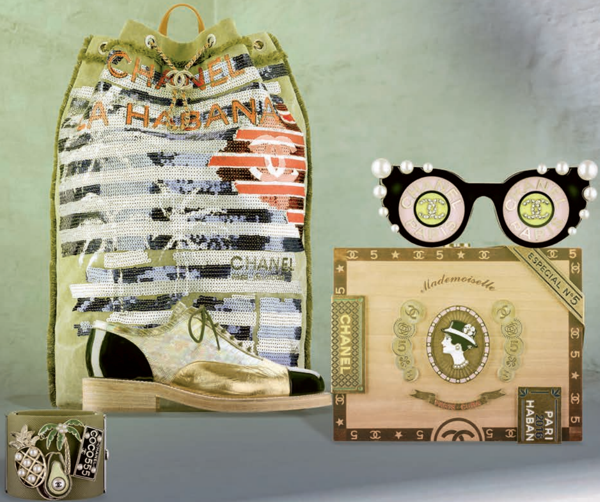
จากซ้ายไปขวา กำไลผ้าแคนวาสสีกากีตกแต่งชั้นประดับโลหะลงยา, แบริดแพ็คแคนวาสสีกากีบักเลื่อม, รองเท้าอ็อกซ์ฟอร์ดหนังสีเงิน ทองและสีดำ, กระเป๋าหิ้วไม้และโลหะสีทองตกแต่งรูปโคโค ชาเนล, เข็มกลัดทรงแว่นตาเรซินสีดำประดับมุก ทั้งหมดจาก CHANEL.