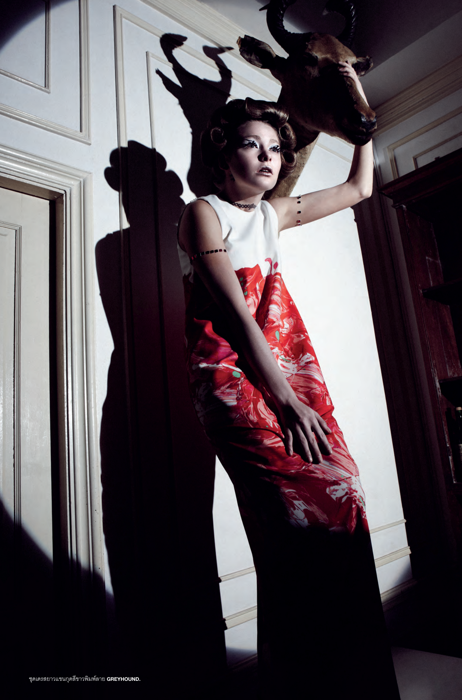
ชุดเดรสยาวแขนงูตสีขาวพิมพ์ลาย GREYHOUND.