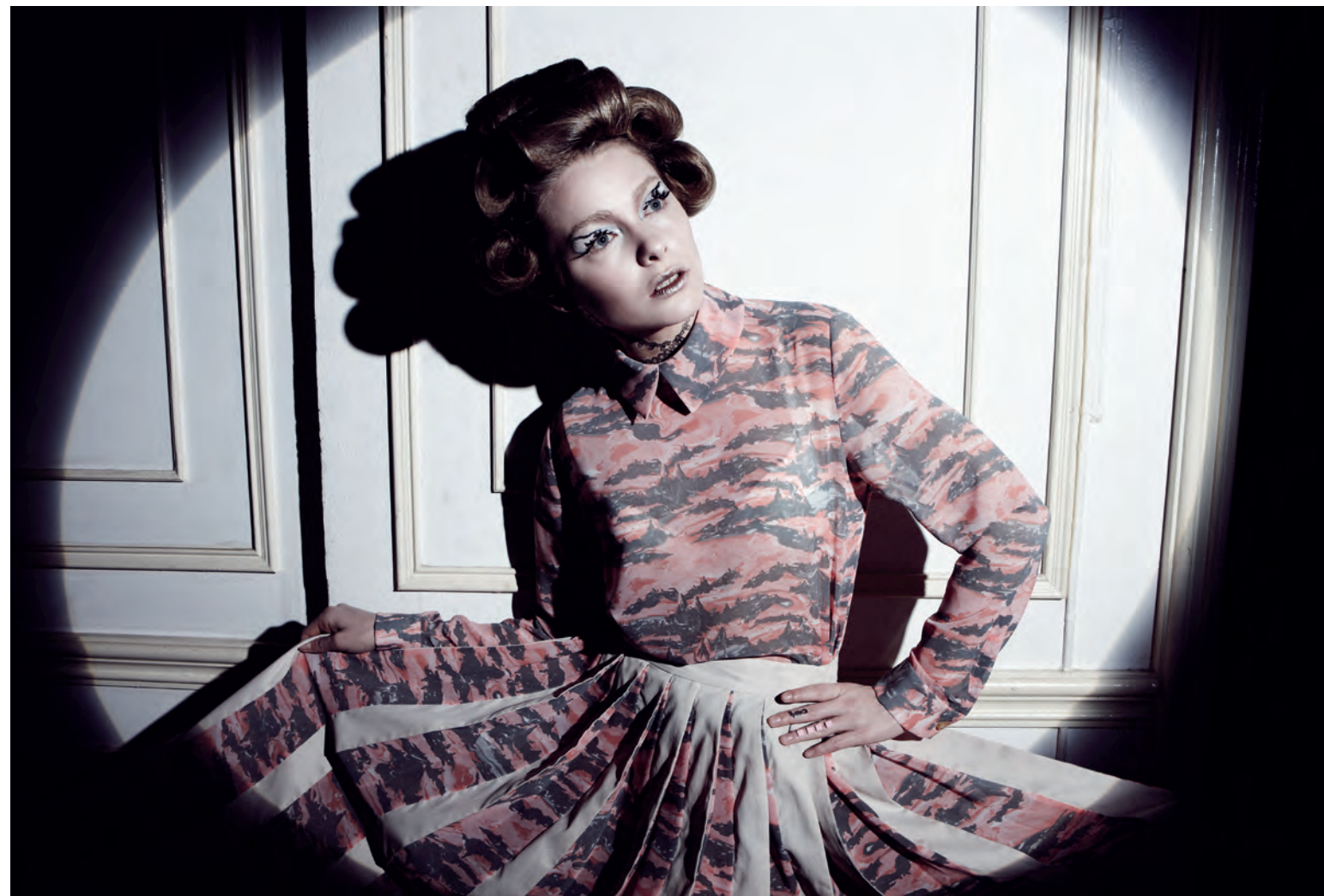
บน เสื้อคอปกพิมพ์ลาย และกระโปรงพลีทสีครีมสลับผ้าพิมพ์ลาย GREYHOUND. ล่าง เสื้อเชิ้ตพิมพ์ลาย และเสื้อโค้ตสีเบจ GREYHOUND.