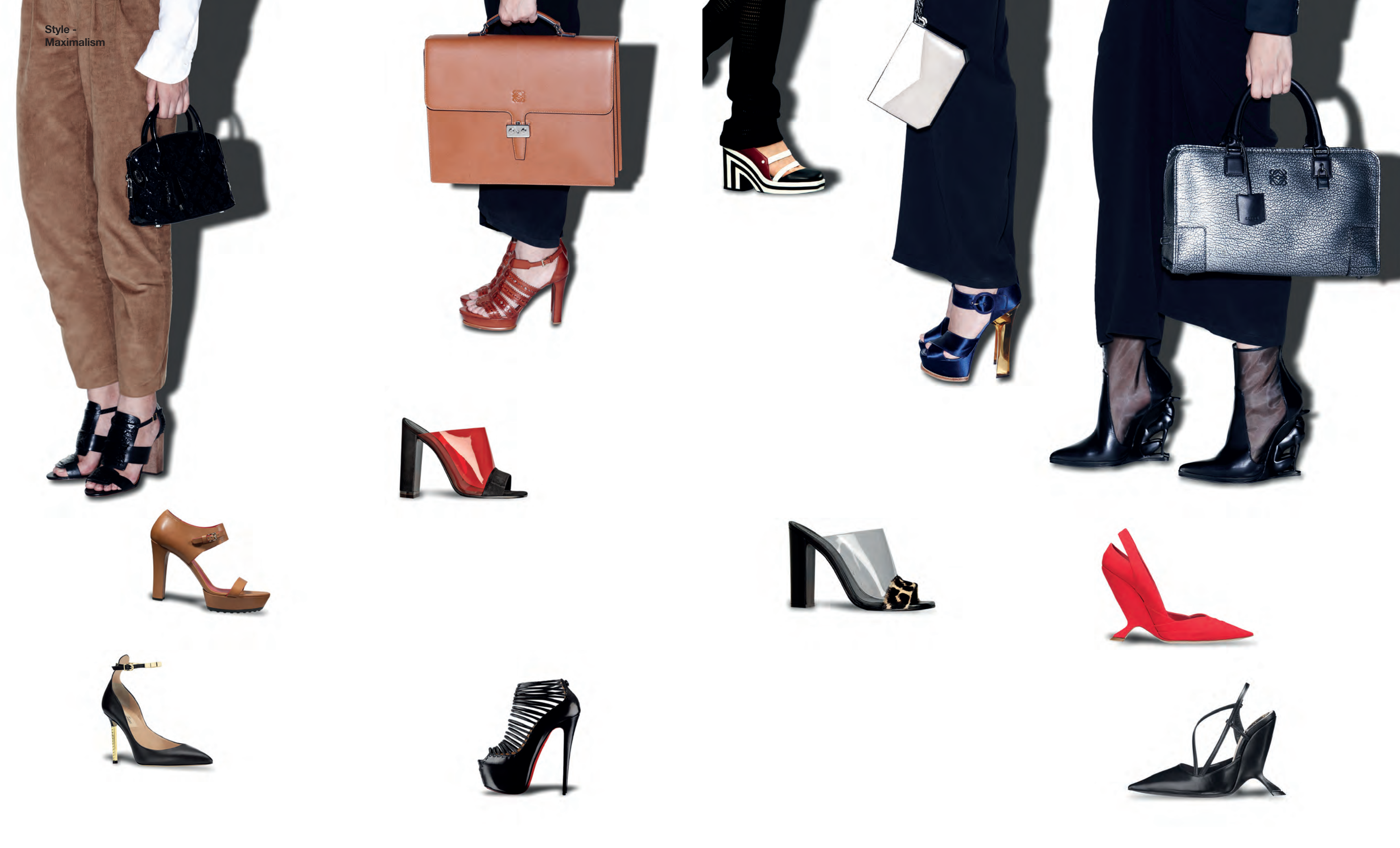
ซ้ายบน กางเกงขายาวผ้าลูกฟูกสีน้ำตาล Agnès B. กระเป๋า Alma หนังสือดำใบเล็กประดับเลื่อม Louis Vuitton. รองเท้าหนังสูงสีดำส้นไม้ Elizabeth and James @Next to Normal. ซ้ายล่าง รองเท้าหนังสูง Tod's. รองเท้าหนังสูงหนังสีดำส้นสีทอง Valentino. ขวามบน กางเกงขายาวสีดำ Agnès B. กระเป๋าเอกสารหนังสีน้ำตาล Loewe. รองเท้าหนังสูงหนังสีน้ำตาลคาลอชลุค Tod's. ขวาล่าง รองเท้าหนังสูงหนังสีดำตกแต่ง พลาสติกสีแดง Céline. รองเท้าหนังสูงหนังสีดำคาดเส้นหนังด้านหน้า Christian Louboutin @Cloud9.