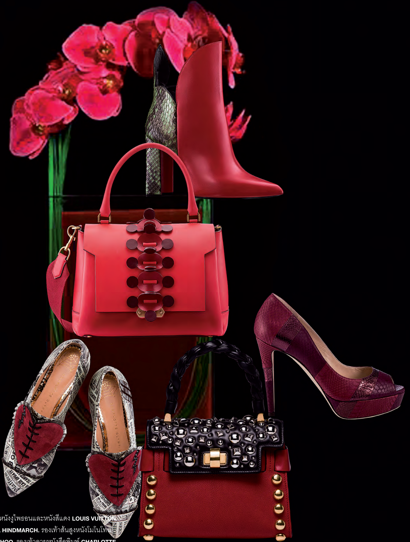
จากบนลงล่าง บู๊ทส์สั้นสูงหนังงูไพธอนและหนังสีแดง LOUIS VUITTON . กระเป๋าหนังสีแดง ANYA HINDMARCH . รองเท้าสั้นสูงหนังโมโนโททอน คัลเลอร์บล็อก JIMMY CHOO . รองเท้าลายหนังสือพิมพ์ CHARLOTTE OLYMPIA . กระเป๋าถือหนังสีแดงดำประดับหมุดทรงกลมสีทอง MIU MIU .