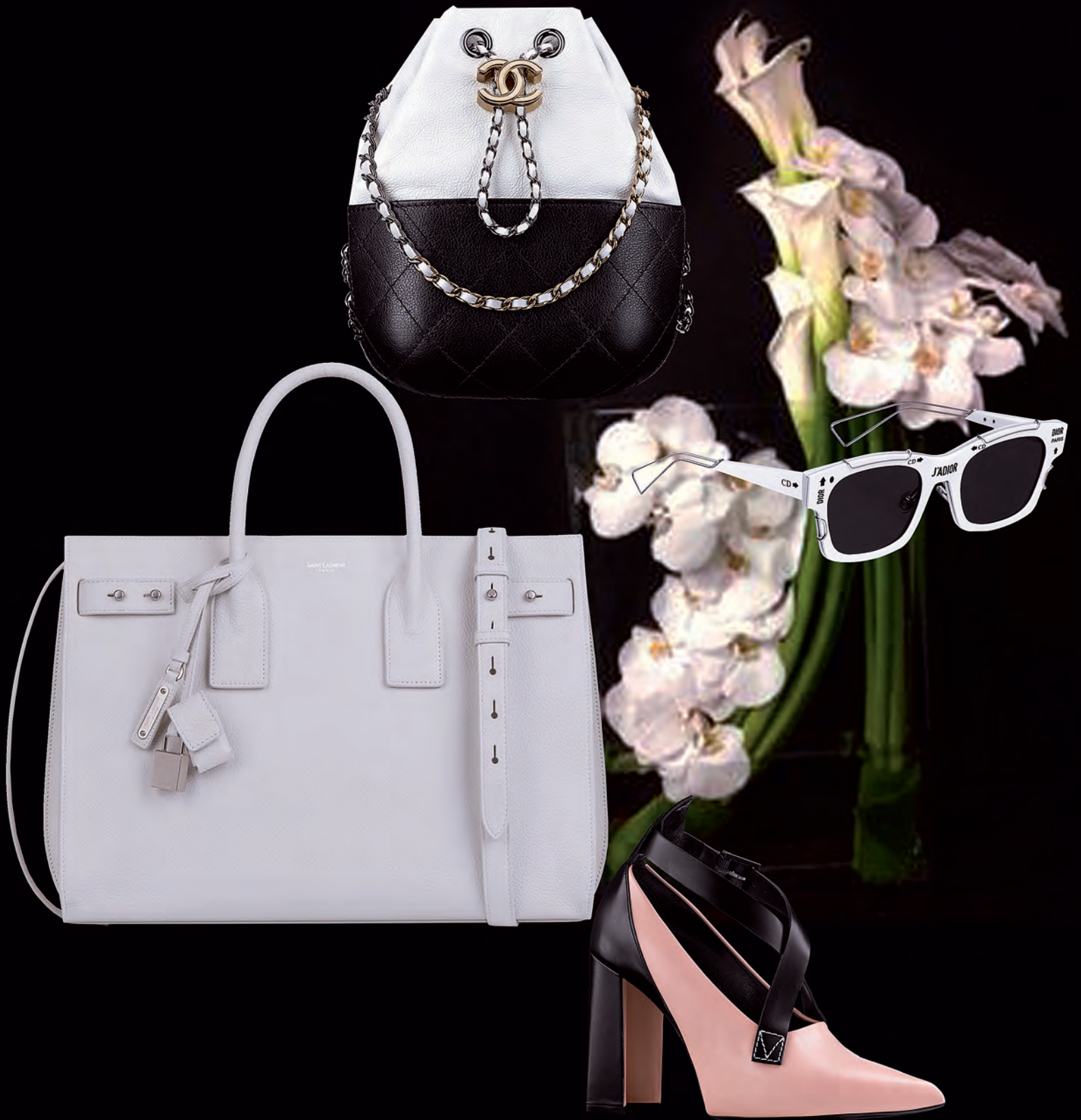
จากบนลงล่าง กระเป๋าหนังสีขาวดำสายสะพายโซ่ร้อยหนัง CHANEL. แว่นตาสีขาว J'Adior DIOR. กระเป๋า Cabas Rive Gauche สีขาว SAINT LAURENT. รองเท้าส้นสูงหนังสีเบจ LOUIS VUITTON.