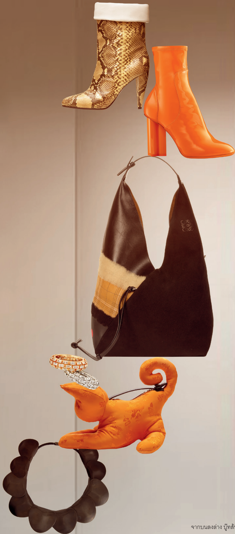
จากบนลงล่าง บู๊ทส์หนังสูงหนัง CÉLINE . บู๊ทส์หนังสูงหนังแก้วสีส้ม LOUIS VUITTON . กระเป๋าสะพายหนังกลับสีดำตกแต่งขนเฟอร์และหนังลายตาราง LOEWE . แหวนนิ้วชี้ GEMS PAVILION . กระเป๋ารูปทรงแมว LOEWE . สร้อยคอ LOEWE .