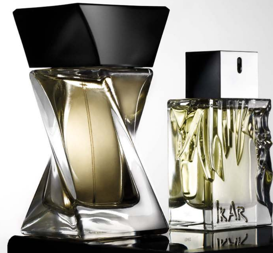
Lancôme Hypnôse Homme น้ำหอมที่ปรุงกลิ่นให้ชวนลุ่มหลงผสานความลงตัวของกลิ่นอโรมาติกและโอเรียนทอล, Sisley Eau D'Ikar กลิ่นหอมแสนหรูสกัดจากพรรณไม้ชั้นสูง สดชื่น อบอุ่นและนุ่มนวลแบบบุรุษ