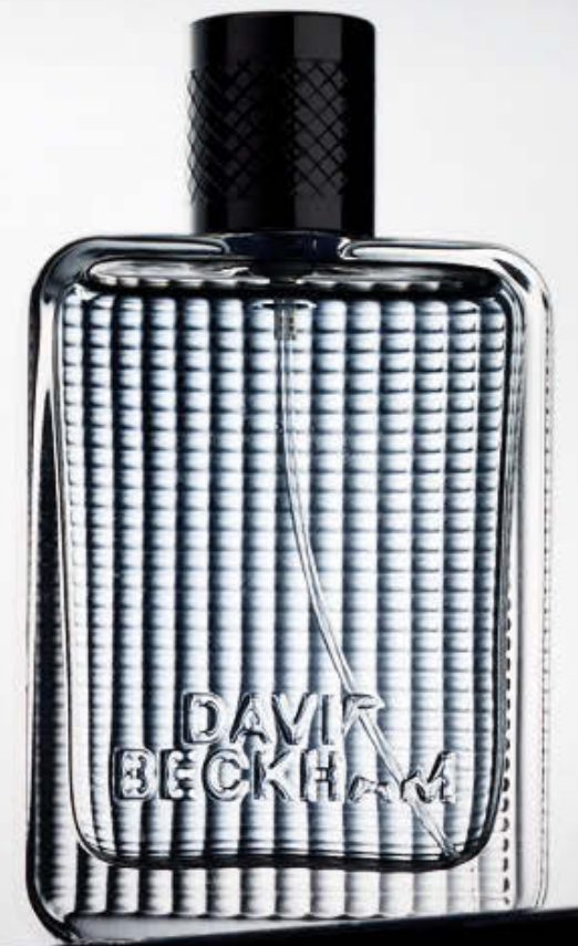
David Beckham The Essence ส่งผ่านกลิ่นหอมแห่งความสุข เชิกซี่และนำหลงไหล เบี่ยมด้วยพลังของนักกีฬา