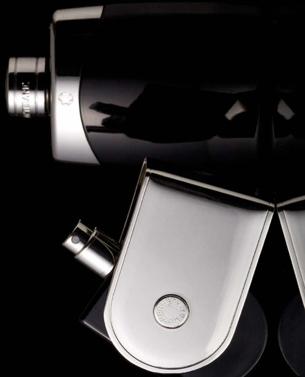
Mont Blanc Legend โลกแห่งความหรูหราของชายหนุ่มทันสมัยและมีชีวิตชีวา Diesel Only The Brave Tattoo เฝยความแข็งแกร่งผ่านกลิ่นหอมอันร้อนแรง Voyage d'Hermès Eau de Parfum หอมปราณีดีในแบบฉบับแอร์เมส สัมผัสสดชื่น นำค้นหา