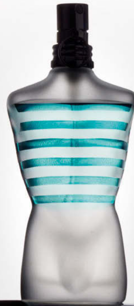
Jean Paul Gaultier Le Beau Male เข้ายวนใจในแบบผู้ชาย ด้วยกลิ่นหอมของวนิดลา สดชื่นจากมันท์