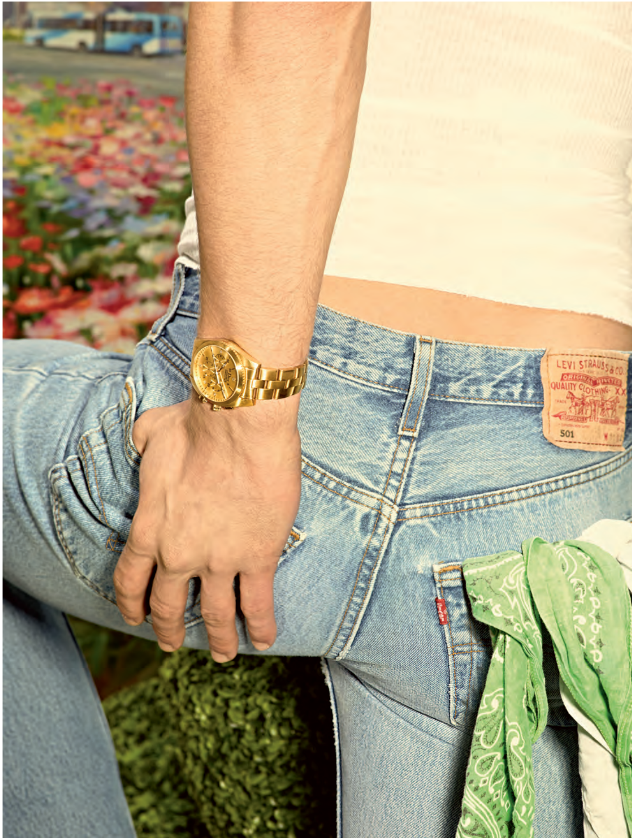
นาฬิกาข้อมือรุ่น "Chiffre Rouge 103" จากทองสีเหลืองและเพชร สายจากทองสีเหลือง Dior Horlogerie . เลื่อยึดจากผ้าฝ้าย Petit Bateau . กางเกงยีนส์ผ้าฝ้ายสไตลวินเทจ Levi's . ผ้าพันคอ Hippy Market .