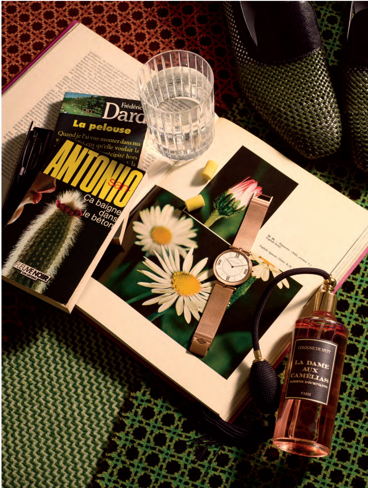
นาฬิกาข้อมือรุ่น "Pierre Arpels" จากทองกุหลาบ สายสร้อยจากทองเมืองมิลาน Van Cleef & Arpels. รองเท้า Bottega Veneta. โคลิญาจน์ "La Dame aux Camélias" Jardins d'Écrivains.