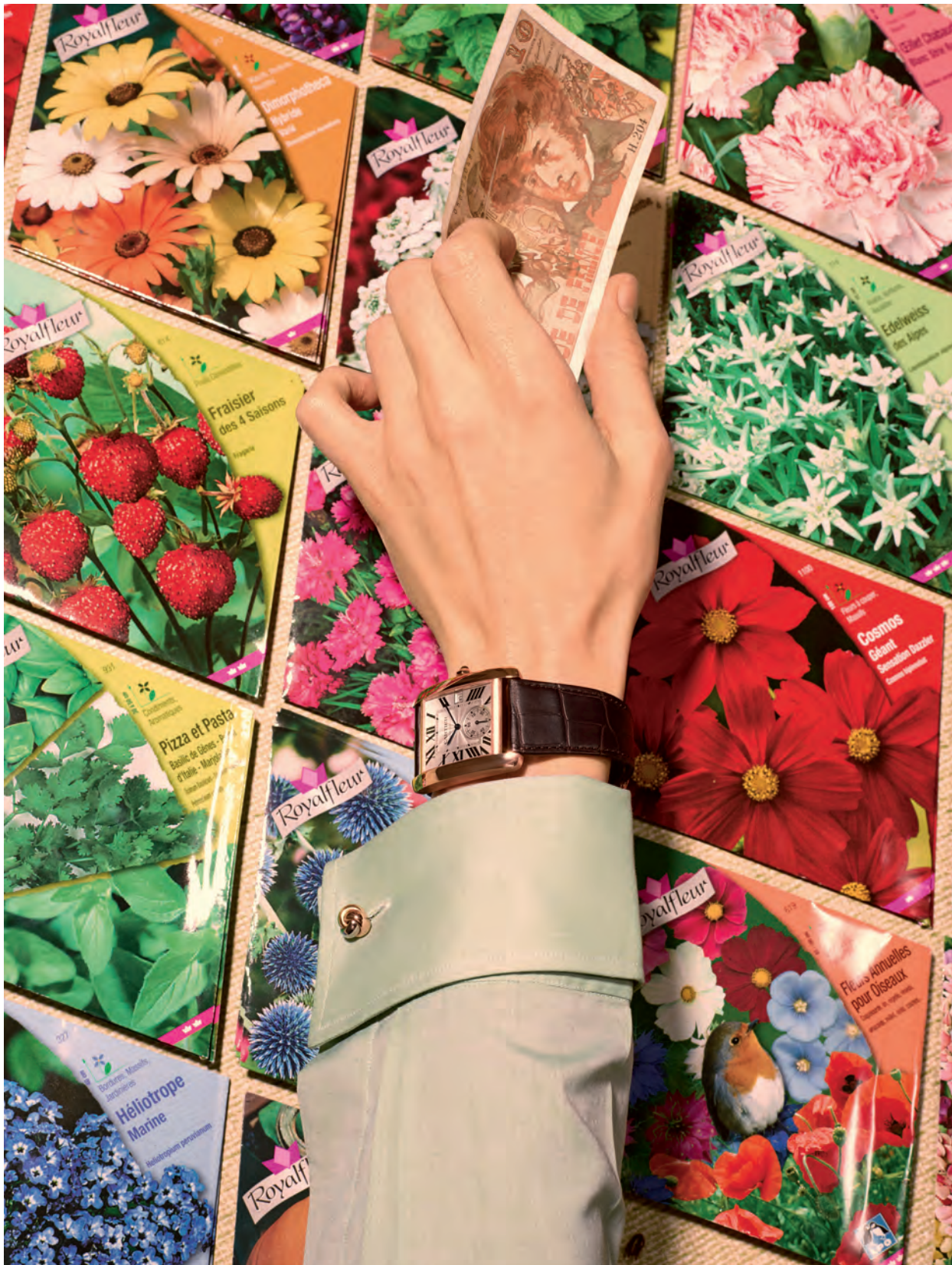
นาฬิกาข้อมือรุ่น "Tank" จากทองกุหลาบ สายทำจากหนัง คัฟลิงค์ "Trinity classique" จากทองสีเหลือง ชมพู และเทา Cartier. เสื้อเชิ้ตผ้าไหมผสมฝ้าย Charvet.