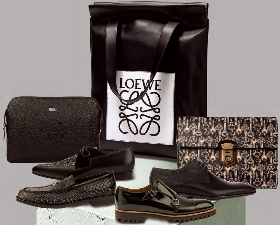
จากซ้ายไปขวาและจากบนลงล่าง รองเท้าโลเฟอร์หนังสีดำตกแต่งหมุดโลหะ Emporio Armani. รองเท้าหนังประดับคริสตัลลายลิโอพาร์ด Christian Louboutin. กระเป๋าหนังใบเล็ก Boss. กระเป๋าใส่ตลับหมึกสีดำ Loewe. คลัตช์พิมพ์ลายกุญแจ Dolce & Gabbana. รองเท้าหนังสีดำผูกเชือก Boss. รองเท้าหนังสีเขียว Bally.