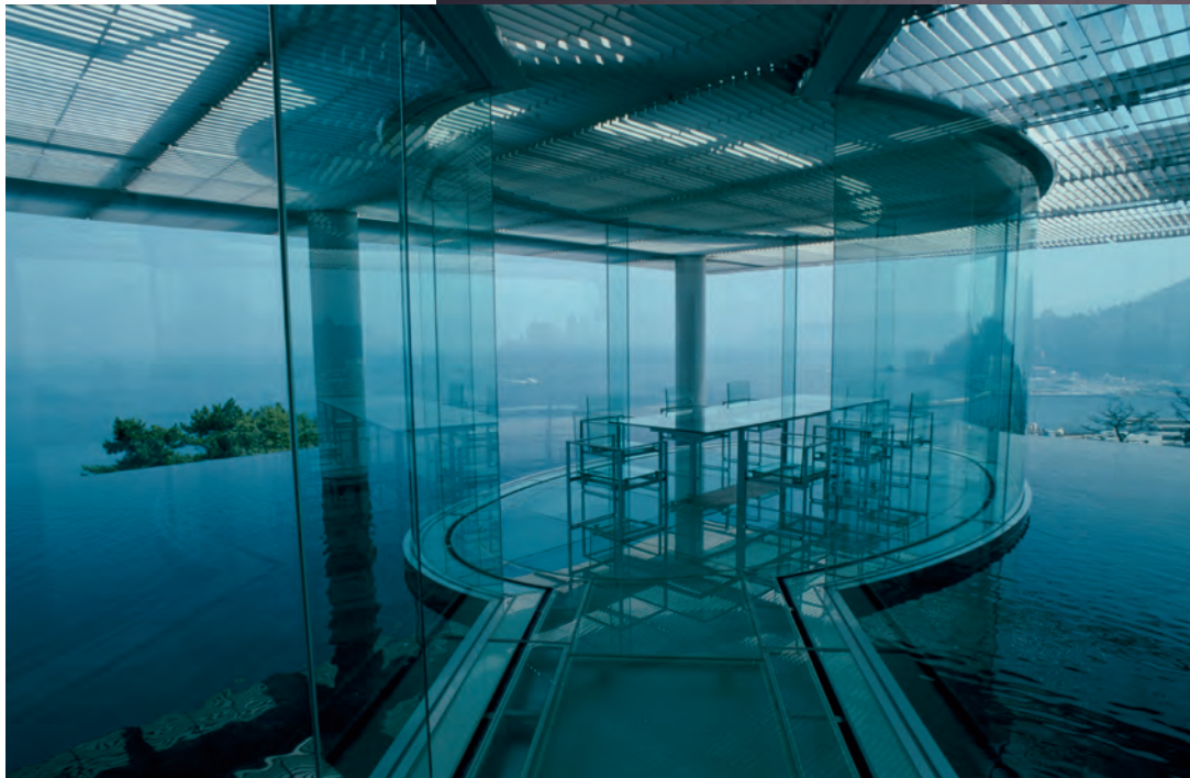
Nakagawa-machi Bato Hiroshige Museum