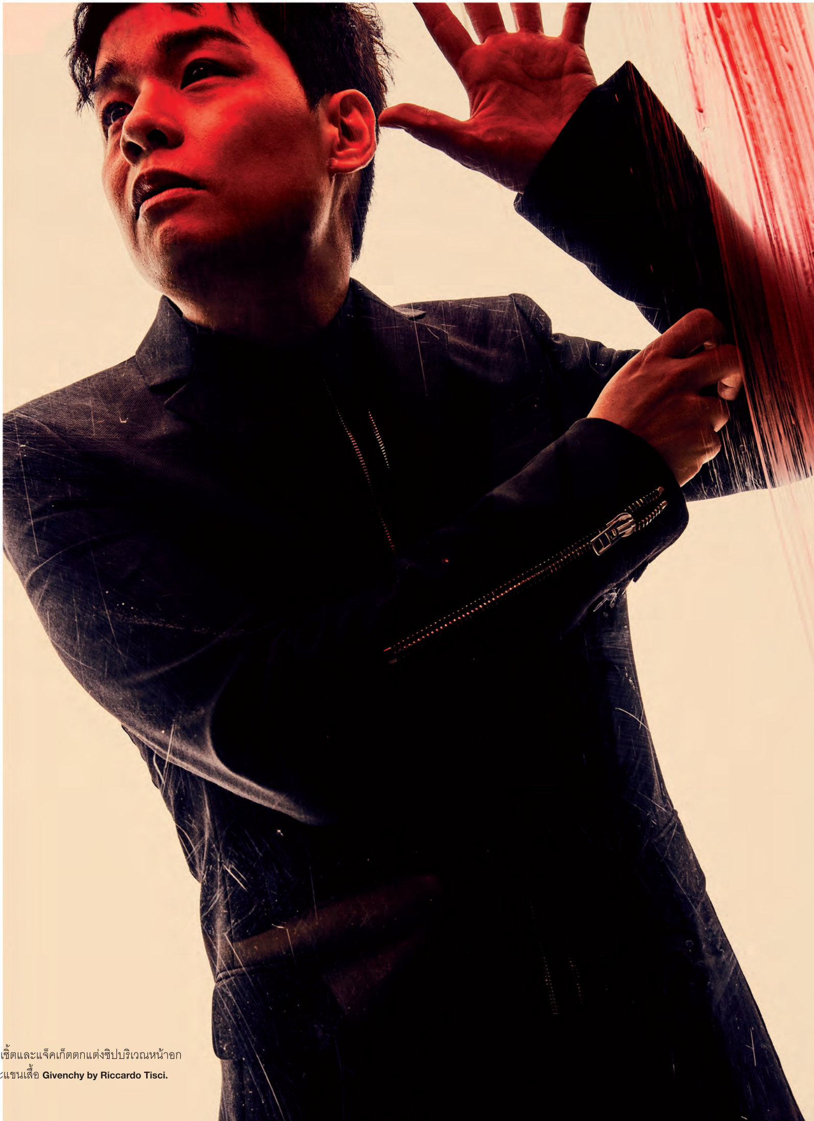
เสื้อเชิ้ตและแจ็กเก็ตตกแต่งชิปบริเวณหน้าอก และแขนเสื้อ Givenchy by Riccardo Tisci.