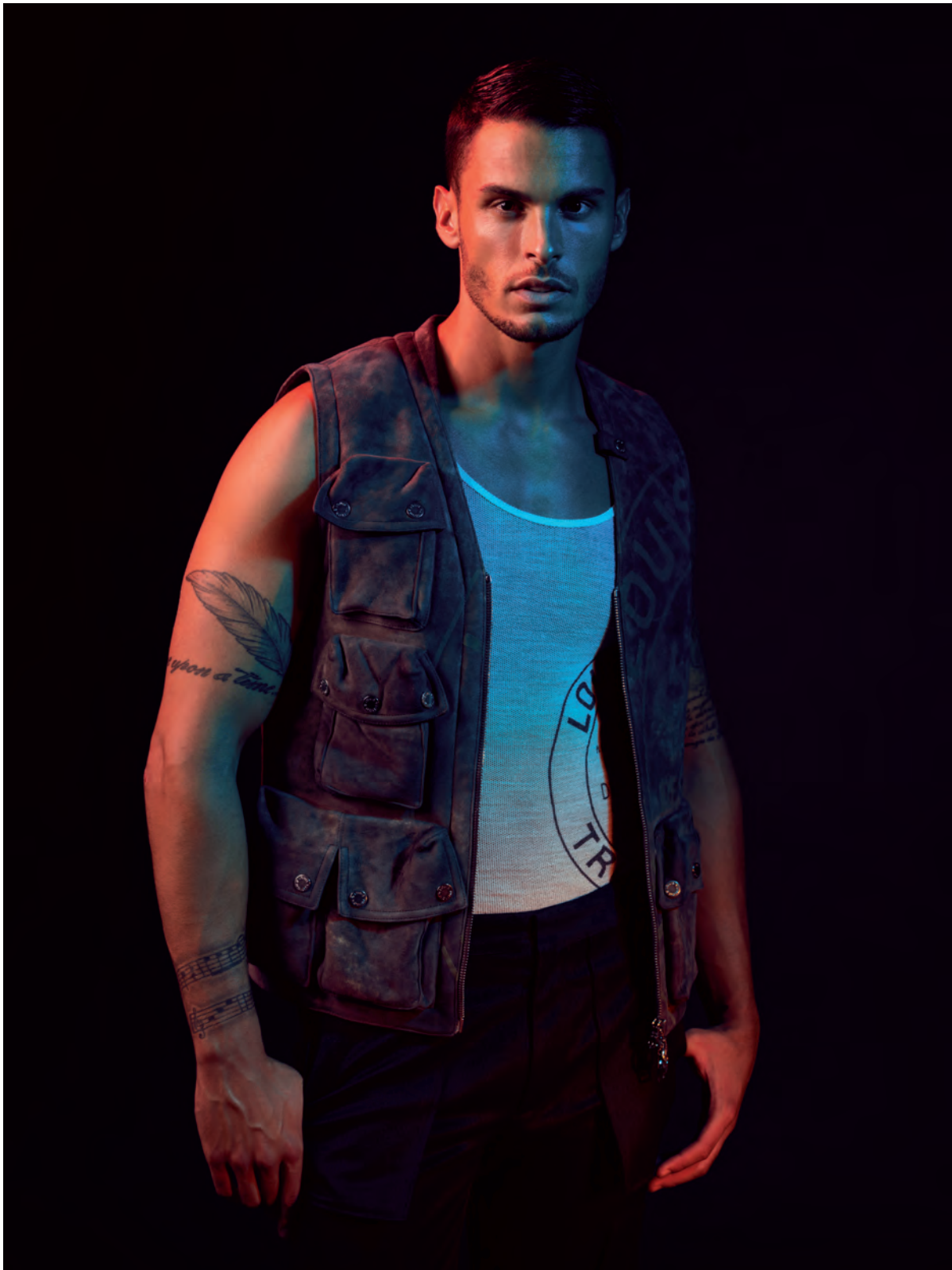
เสื้อแจ็คเก็ตแขนกุด เสื้อกล้ามสีขาว กางเกงขายาว Louis Vuitton.