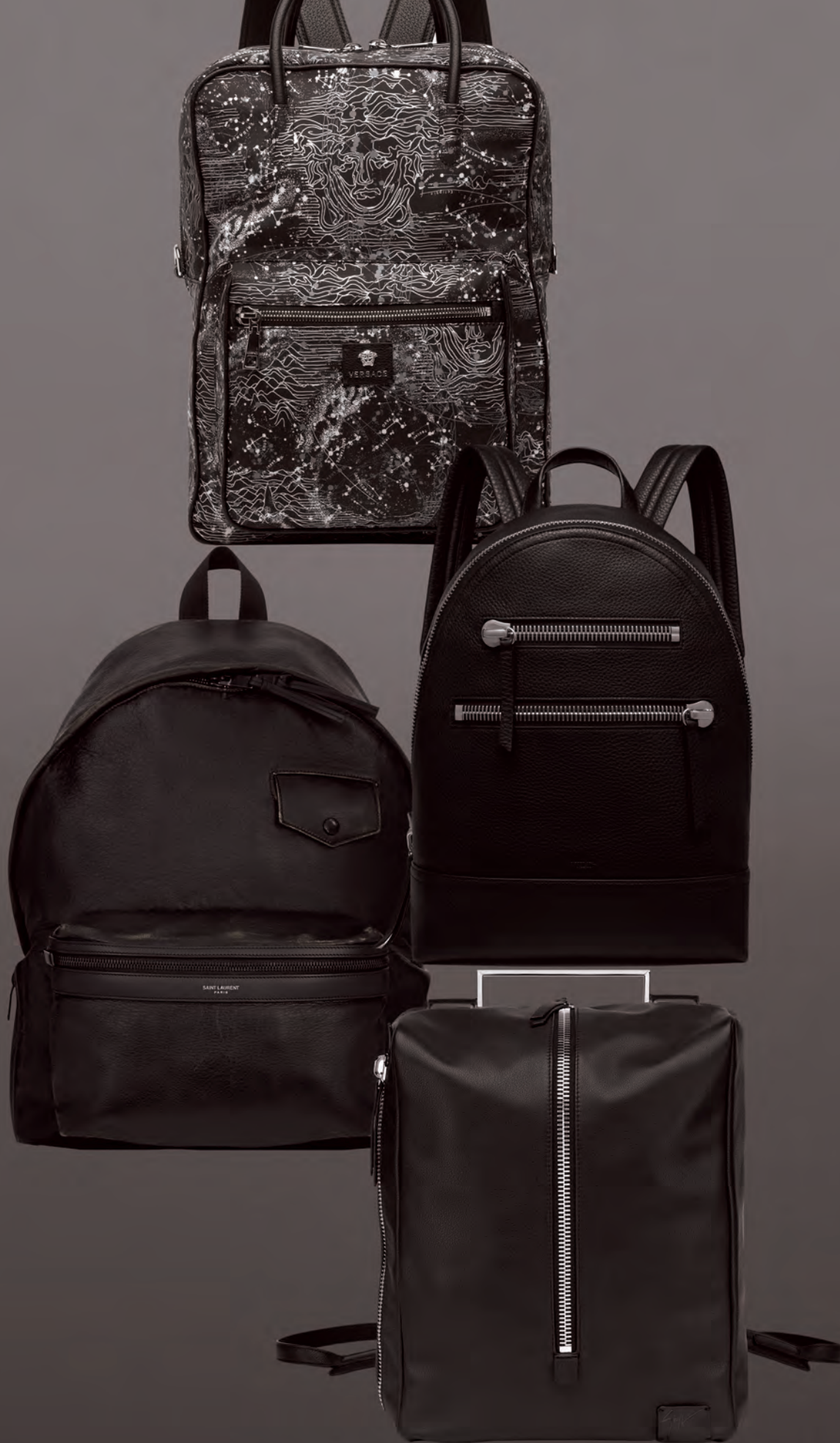
จากบนลงล่าง กระเป๋าเป้ลายกราฟิก Versace . กระเป๋าเป้ ชิปสีเงิน Mulberry . กระเป๋าเป้ติดกระเป๋ Saint Laurent . กระเป๋าเป้ทรงสี่เหลี่ยม Giuseppe Zanotti .