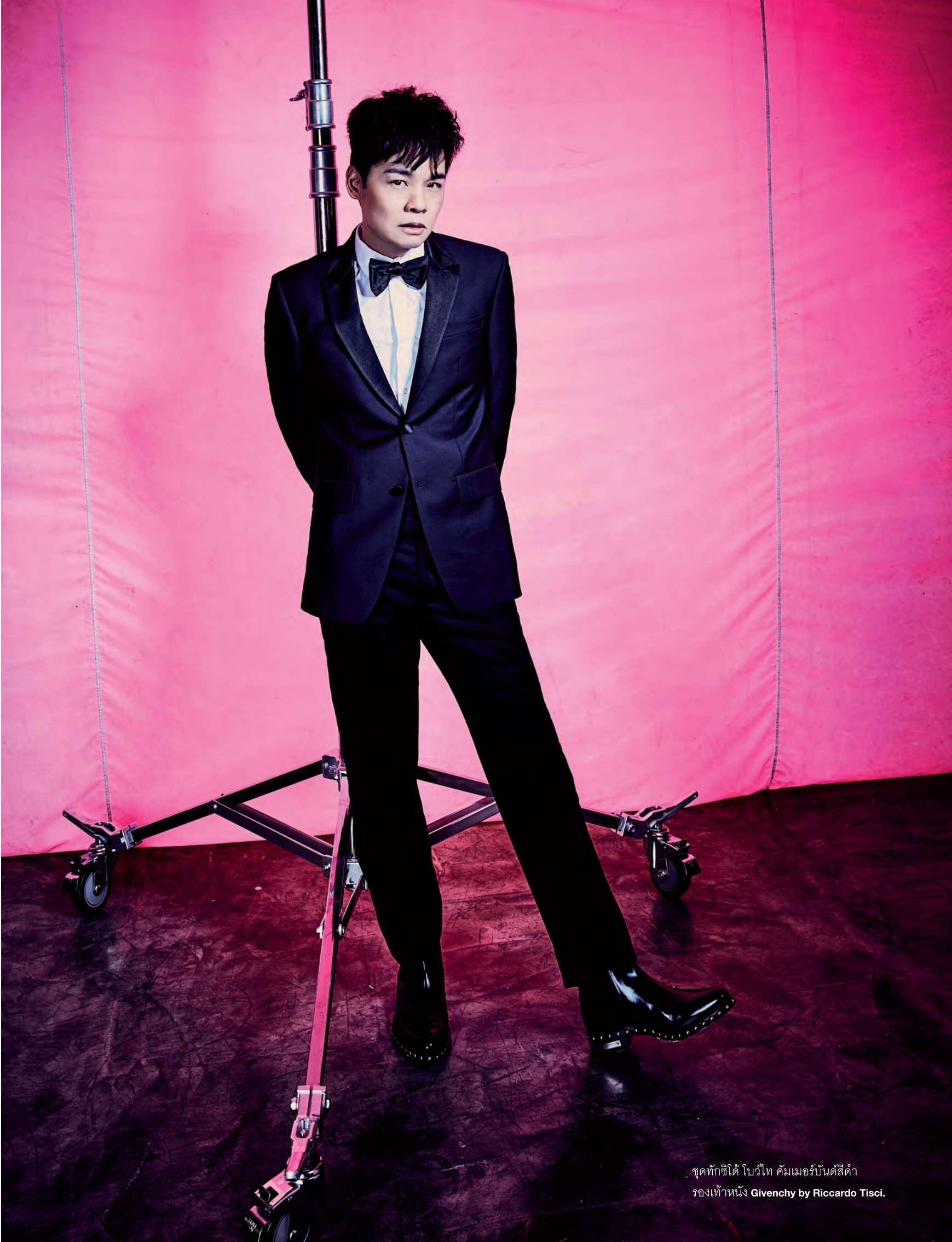
ชุดทักซิโด โบว์ไทป์ คิมเมอร์บันด์สีดำ รองเท้าหนัง Givenchy by Riccardo Tisci.